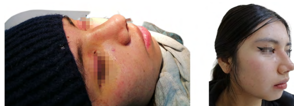
Figura 3. Resultado post-quirúrgico mediato

Se realizó la Escala DASS-21, dos meses después de su cirugía, con los resultados reflejados en la tabla 2.