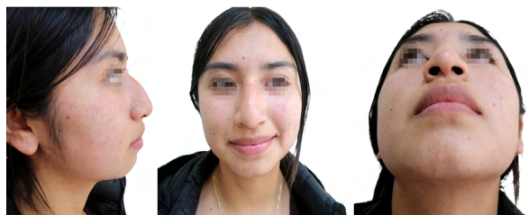
Figura 2. A Perspectiva lateral B Perspectiva frontal C Perspectiva inferior

Durante el examen físico se observa: Desviación de la pirámide nasal a la derecha, presencia de una protuberancia dorsal osteocartilaginosa, punta nasal sin proyección, asimetría de las dos fosas nasales. (Ver Figura 2)